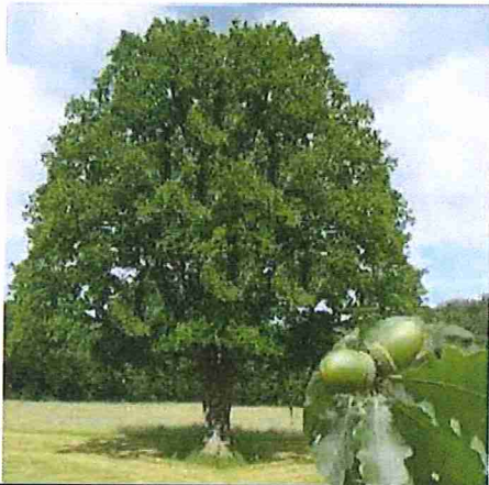
Surnommé roi de la forêt, le chêne sessile peut atteindre des hauteurs de plus de 40 mètres et des âges spectaculaires.