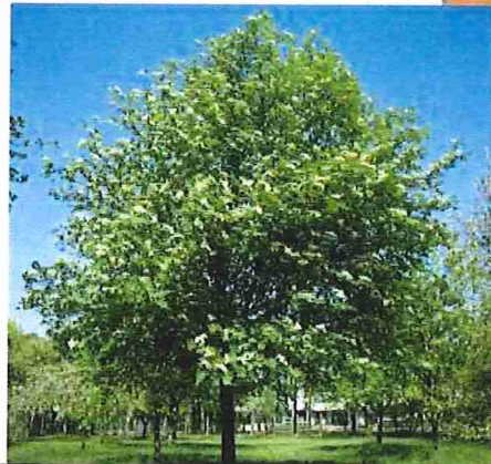
L'alisier est un arbre forestier de belle allure réputé pour son bois à grains fins et ses baies acidulées.