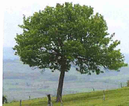
C'est un arbre qui donne des fruits appelés « cormes » ressemblant à des petites pommes ou poires, d'où leur surnom de poirillons.