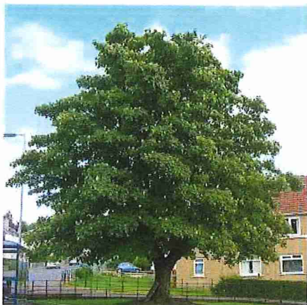
Essence collinéenne et de montagne, l'érable sycomore peut vivre 500 ans et produit du bois très recherché.